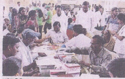
आरोग्य शिबिरात तपासणीसाठी असलेली नागरिकांची गर्दी.