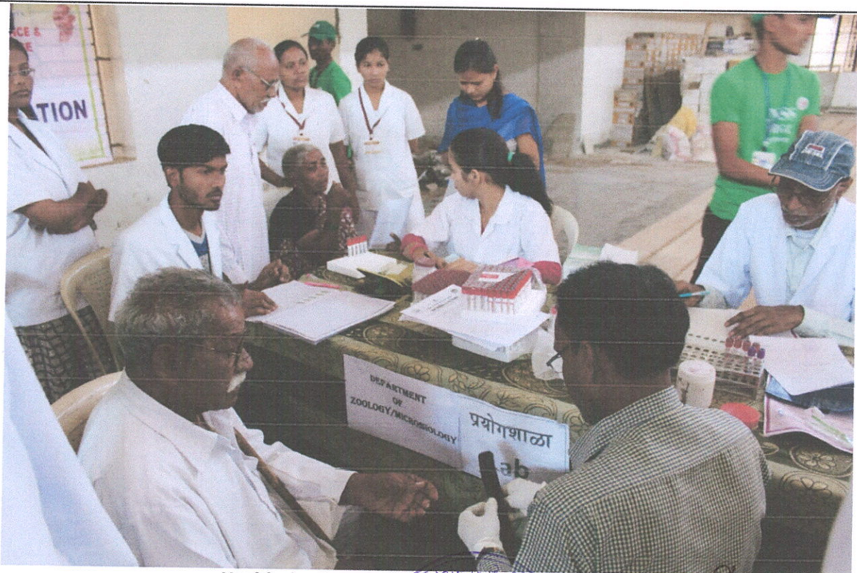
Health check-up and medical testing of civilians