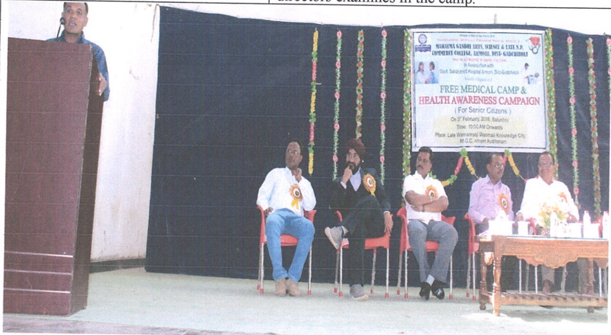
Innagation of Free Medical Camp & Health Awarness Campaign

Health examinations and tests at the early stages of the illness can help to cure it faster and save a life before it can cause any damage. One can live longer and healthier only when the individual gets the right kind of health check-up, screening, and treatments. Even the most basic checkups can identify underlying illnesses. 90 civilian and 30 staff and MSPM directors examines in the camp.